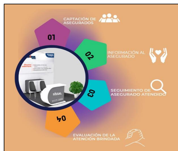
Figura N.º 02: Estrategia aplicada en los módulos FISSAL